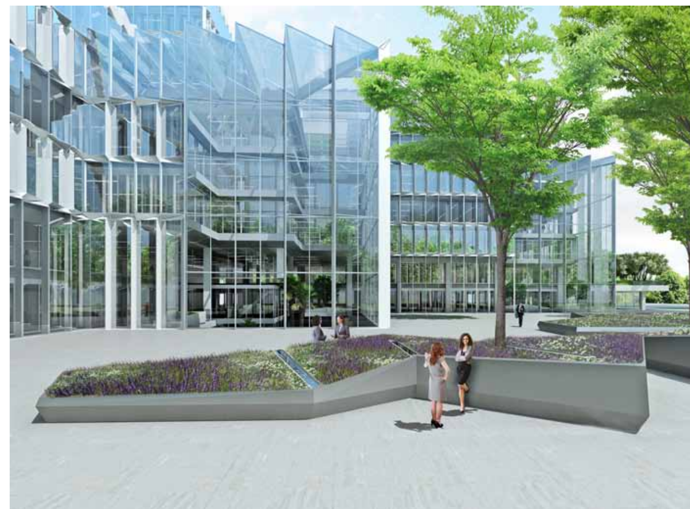
Meer plaats voor interactie en ontmoeting.