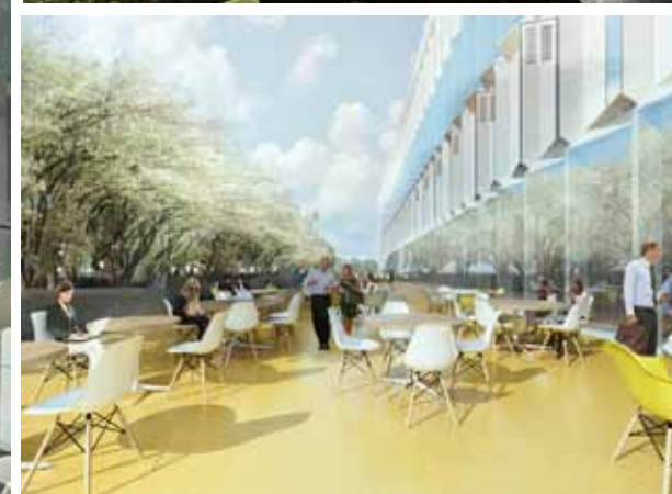
Foto's van boven naar beneden: - Daglicht dringt diep binnen dankzij glazen gevel en dakvides - Her en der aangebrachte vides zorgen voor gevarieerd interieur - 'Substantieel groene' buitenruimte